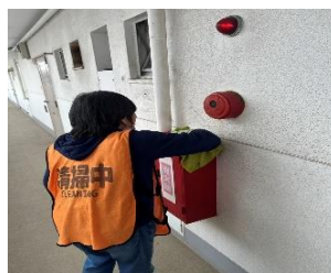
マンション共用部②