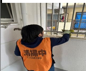
マンション共用部①